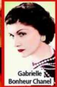
Gabrielle Bonheur Chanel

AKDENİZ Tekstil ve Hammaddeleri İhracatçıları Birliği (ATHİB) tarafından bu yıl altıncısı düzenlenen Dokuma Kumaş Tasarım Yarışması'nın ödül töreni yapıldı. Ekonomi Bakanı Nihat Zeybekci, Avrupa Birliği Bakanı Ömer Çelik'in de katıldığı törende konuşan