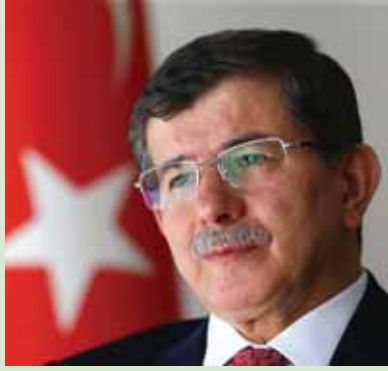
Başbakan AHMET DAVUTOĞLU

Dünya büyük bir krizden geçiyor. Türkiye, Avrupa'da en hızlı büyüyen ülkeler arasında. Bu ekonomi ikliminde dev bir adım atıyor ve üreticilerin yanında olduğumuzu gösteriyoruz. İşverenlere çok ciddi katkılarımız olacak. Altı ay süreyle iş başı eğitimle çalışacak kursiyerlerin net asgari ücretini ödeyeceğiz. Bu çok ciddi bir mesleki eğitim desteğidir. Diğer yandan, iş başı eğitim programı sonrası kursiyerler işe alınırsa, imalat sektöründe 3,5 yıl, diğer sektörlerde ise 30 ay boyunca SGK işveren primi İŞKUR tarafından ödenecek. Temmuz'a kadar bu işbaşı eğitime başlanırsa, iş başı eğitim için verilecek destek altı ay değil bir yıl olacak.