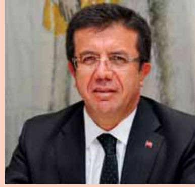
Ekonomi Bakanı NİHAT ZEYBEKÇİ

dirilerek sanayicinin girdi maliyeti azaltılacak. - 2015-2016 harcamaları için Yatırıma Katkı Tutarı'nın yatırım döneminde uygulanacak oranları 1. Bölge'de yüzde sıfırdan yüzde 50'ye, 2. Bölge'de yüzde 10'dan yüzde 55'e, 3. Bölge'de yüzde 20'den yüzde 60'a, 4. Bölge'de yüzde 30'dan yüzde 65'e, 5. Bölge'de yüzde 50'den yüzde 70'e çıkıyor. 6. Bölge'de ise yüzde 80 olarak devam edecek. • İleri teknoloji sınıfında yer alan yatırımlar, öncelikli yatırımlar kapsamına alınacak ve 5. Bölge desteklerinden yararlandırılacak. • Yılsonuna kadar başlanacak yatırımlar, daha yüksek oran ve sürelerde desteklenecek. • 2014 yılı sonunda uygulaması sona eren vergi indirimi ve sigorta primi işveren hissesi desteğindeki yüksek oran ve süreler, yılsonuna kadar başlanacak yatırımlar için uygulanmaya devam edilecek. • Bölgesel teşvik uygulamalarında Yatırıma Katkı Oranı, yılsonuna kadar başlanan yatırımlarda 1. Bölge'de yüzde 10'dan yüzde 15'e, 2. Bölge'de yüzde 15'ten yüzde 20'ye, 3. Bölge'de yüzde 20'den yüzde 25'e, 4. Bölge'de