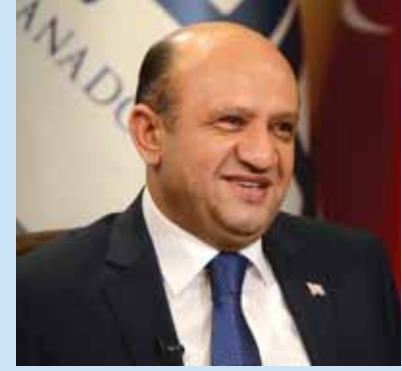
Sanayi Bakanı FİKİRİ İŞİK

yüzde 25'ten yüzde 30'a, 5. Bölge'de yüzde 30'dan yüzde 40'a, 6. Bölge'de ise yüzde 35'den yüzde 50'ye çıkarılacak. • Sigorta primi işveren hissesi desteğinde yılsonuna kadar başlanacak yatırımlarda süre artırılacak. Sigorta primi işveren hissesi desteği mevcutta 1'inci ve 2. Bölgelerde uygulanmazken yeni paket ile 1. Bölge'de iki yıl, 2. Bölge'de ise üç yıl olarak uygulanacak. 3. Bölge'de destekler üç yıldan beş yıla, 4. Bölge'de beş yıldan altı yıla, 5. Bölge'de altı yıldan yedi yıla ve 6. Bölge'de ise yedi yıldan 10 yıla çıkarılacak. • Tasarım merkezleri, Ar-Ge merkezleri gibi desteklenecek. • Ar-Ge ve tasarım personelinin daha esnek çalışmasına olanak sağlanacak. • KOBİ'lerin siparişe dayalı Ar-Ge ve tasarım faaliyetleri desteklenecek. • TÜBİTAK tarafından başta enerji, ulaştırma ve sağlık sektörleri olmak üzere imalat sanayisinde hazırlanan projeler Türkiye Kalkınma Bankası aracılığı ile desteklenecek. Bu kapsamda fizibilite çalışmaları TÜBİTAK tarafından