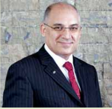
TİM Başkanı MEHMET BÜYÜKEŞÇİ

İstihdam, Sanayi Yatırımı ve Üretimi Destekleme Paketi'ni son derece olumlu karşıladık. Özellikle istihdam, teknoloji ve eğitim konusundaki yaklaşımları gayet önemli ve pozitif bulduk. Bu pakette tasarım merkezlerinin Ar-Ge merkezleri gibi desteklenmesi, on yıllardır devam eden yatırım mallarına KKDF uygulanması gibi sorunların çözümü var. Bu paketin yüksek katma değerli ürünlerin ihracatımızdaki payının artırılması ve uzun vadede cari açığımızın azaltılması için büyük katkı sağlayacağına; yüksek katma değerli ihracat artışı ile 2023 hedeflerimize büyük katkı sağlayacağına inanıyoruz.