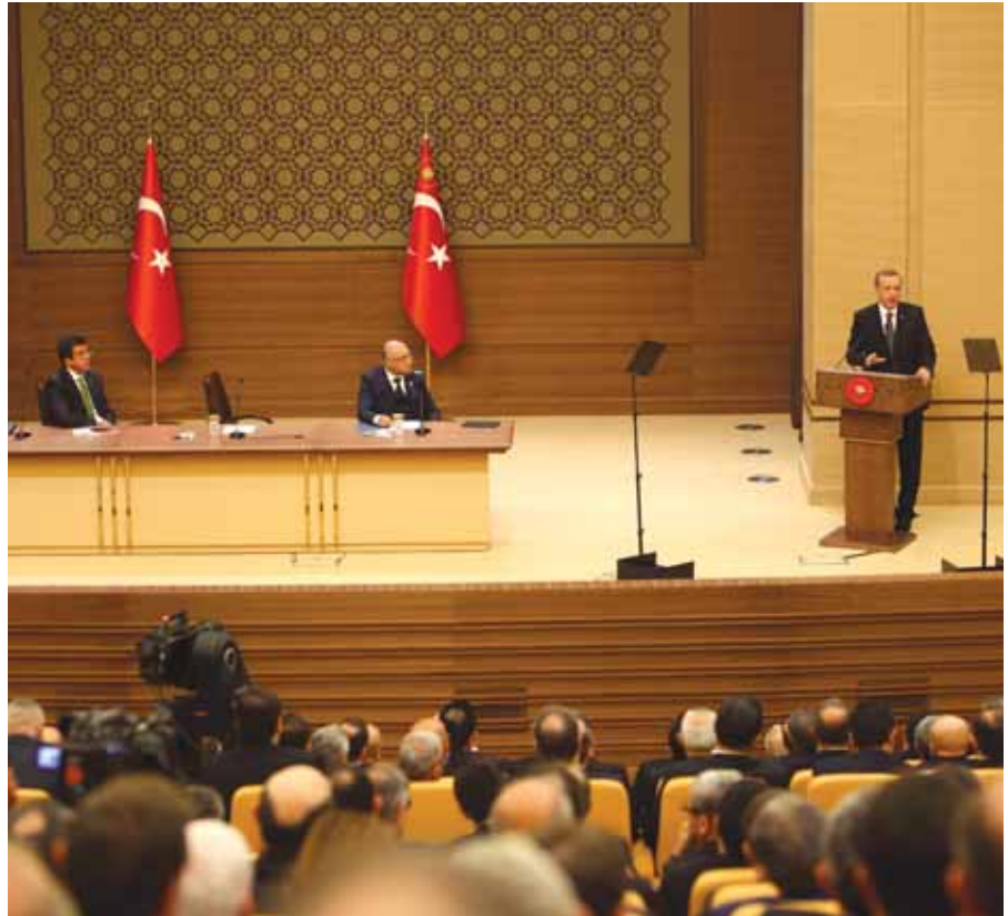
Cumhurbaşkanı Recep Tayyip Erdoğan, konuşmasının sonunda, ihracatçıların 2023 yılında 500 milyar dolar ihracat hedefi sözünü tutma yönündeki kararlılığını gördüğünü de ifade etti ve bu çerçevede çabaları için TİM'e şükranlarını sundu.

SON 12 YILDA İHRACATIMIZ BÜYÜK AŞAMA KAYDETTİ, 36 MİLYAR DOLARDAN BUGÜN 158 MİLYAR DOLARA YÜKSELDİ.