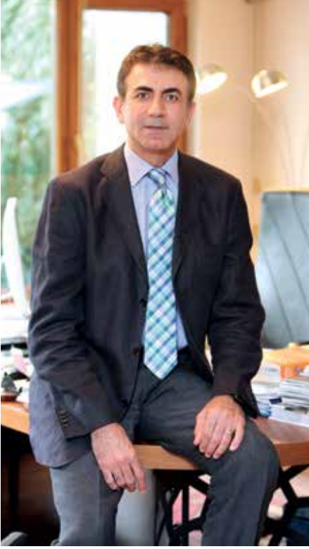
Akdeniz Hazırgiyim ve Konfeksiyon İhracatçıları Birliği Başkanı