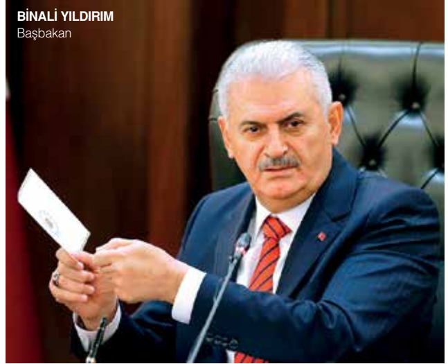
“İhracatçımıza şartları belirlenecek şekilde hususi pasaport vereceğiz. Kapılarda perişan olmasınlar.”

Yatırımları artırmak için iki önemli adım atılacak. Bu doğrultuda Kalkınma Bankası işler hale getirilerek yatırımcıya daha iyi şartta kredi verilmesi sağlanacak.