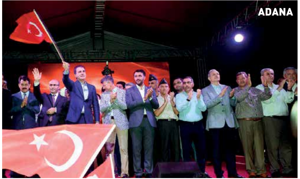
Türkiye'nin bütün şehir meydanlarında 3 hafta boyunca darbecilere karşı halk kararlılığını düzenlediği demokrasi nöbetleri ile ortaya koydu.

Aralarında TİM'in de bulunduğu, iş, sanat ve siyaset dünyasından önemli isimlerin oluşturduğu "Ortak Akıl Platformu" 4 Ağustos gecesi Taksim Meydanı'ndaki Demokrasi Nöbeti'ne katıldı. TİM Başkanı Büyükekeşi'nin de eşlik ettiği gecede hep birlikte "Memleketim" şarkısı seslendirildi. 203 sivil toplum kuruluşunun katılımıyla oluşan "Ortak Akıl Platformu", ellerinde Türk bayrakları, demokrasi şehitlerinin posterleri ve çeşitli dövizlerle Taksim Meydanı'nda bir araya gelen çok sayıda vatandaş, darbe girişimini protesto etti. Beyoğlu Belediyesi ev sahipliğinde düzenlenen etkinlikte, konuşmaların ardından