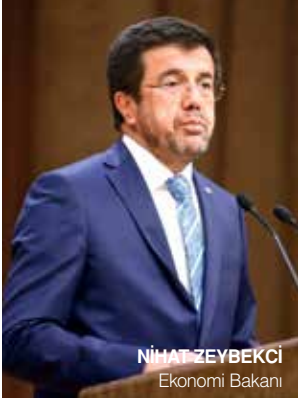
NİHAT ZEYBEKÇİ Ekonomi Bakanı

"Türkiye'de yatırımı olan uluslararası şirketlerin CEO'ları ve TİM, TOOBB, MÜSİAD, TUSİAD, Müteahhitler Birliği gibi kuruluşlarımızla birlikte bir ay boyunca 16 ülkeyi ziyaret edeceğimiz bir kampanyaya başlıyoruz."