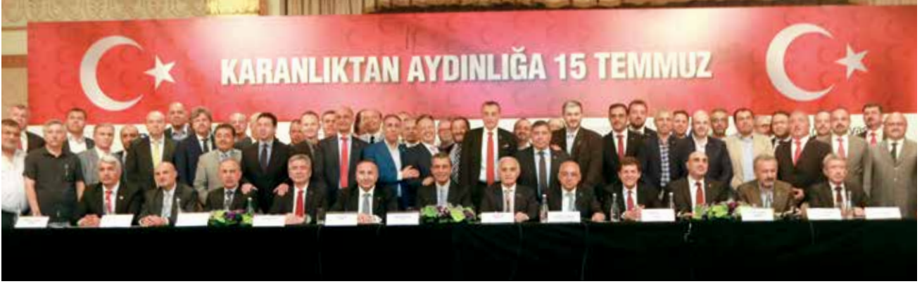
TİM, AŞKON, DEİK, Deniz Ticaret Odası, İstanbul Sanayi Odası, İstanbul Ticaret Borsası, İstanbul Ticaret Odası, MÜSİAD, TAMPF, TÜMSİAD ve YASED'den oluşan Sivil Toplum Kuruluşları Demokrasiye ve Milli İradeye Darbe Girişimine karşı ortak basın bildirisini yayınladı.

tedbirleri almıştır. Türkiye, global krizlere karşı ayakta durmayı başaran, G20 üyesi ve AB adayı, serbest piyasa ekonomisini ve çok partili siyasi sistemi içselleştirmiş güçlü bir ülkedir. İlk refleks olarak olumsuz etkiler hissetsek de ülkemizin güçlü imajı, kısa sürede hem iç pazarda hem de dış pazarlarda bu olumsuzlukları bertaraf edecektir. Keza, kamuoyunun da izlediği gibi bütün piyasalar süratle normal seyrine ulaşmıştır. Bundan sonra da bizler daha çok çalışarak ve üretmek ekonomimizi büyütme devam edeceğiz. Şimdi, paralel terör örgütü darbecilerinin hukukla yüzleşme ve milletin derin hafızasında mahkûm olma zamanıdır. Bu ihanet tezgahını tasarlayan hainlerin hukuk çerçevesinde yargılanarak, en ağır ve caydırıcı cezaları almasını bekliyoruz.