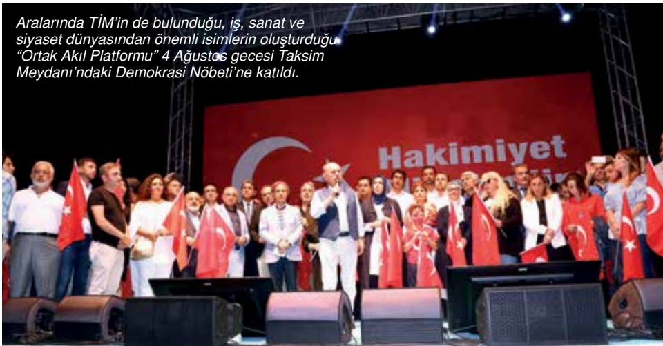
Aralarında TİM'in de bulunduğu, iş, sanat ve siyaset dünyasından önemli isimlerin oluşturduğu "Ortak Akıl Platformu" 4 Ağustos gecesi Taksim Meydanı'ndaki Demokrasi Nöbeti'ne katıldı.

7 Ağustos'da Yenikapı'da buluştu. Milyonları bir araya getiren Demokrasi ve Şehitler Mitingi'nde Türkiye Cumhuriyeti'nin tarihinde ilk defa Cumhurbaşkanı, Meclis Başkanı, Genelkurmay Başkanı ve siyasi parti liderleri aynı mitingde bir araya geldi. Başbakan Binali Yıldırım kalabalığa "16 Mayıs 1919'da Mustafa Kemal Bandırma Vapuru ile İstanbul'dan ayrılırken ne kadar umutluysa milletimiz bugün o kadar umutludur. 6 Ekim 1923'te geldikleri gibi giden düşmanın arkasından ne kadar coşku luysa bugün de o kadar coşkuludur" diye seslendi. Mitingde parti liderlerinden sonra Cumhurbaşkanı Erdoğan kürsüde halka seslendi. Erdoğan, "Çanakkale'de hangi iradeyle kanını akıttıysa, 15 Temmuz'da da aynı iradeyle FETÖ'yü, darbecileri geri püskürttük. 15 Temmuz dostlarımıza bu ülkenin sadece diplomatik saldırılara değil, askeri sabotajlara karşı da güçlü olduğunu, rayından çıkmayacağını göstermiştir" dedi.