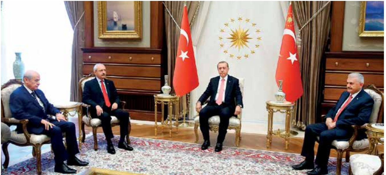
Cumhurbaşkanı Recep Tayyip Erdoğan, AK Parti Genel Başkanı Binali Yıldırım, CHP Genel Başkanı Kemal Kılıçdaroğlu ve MHP Genel Başkanı Devlet Bahçeli ile darbe girişimi karşısındaki kararlı tutumları sebebiyle teşekkür etmek ve önerilerini almak üzere, Cumhurbaşkanlığı Külliyesi’nde görüştü.

dünyanın dört bir yanında duaları ile ellerinde pankartları ile Türk milletinin yanında yer alanlara, Türkiye’nin yanında yer alan dost ülke liderlerine teşekkür etti. 15 Temmuz’un, millet, kökü nerede olursa olsun, hangi güce dayanırsa dayansın bu millete ve bu ülkeye ait olmayanlara karşı tarihi bir meydan okuması olduğunun altını