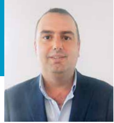
Akdeniz Yaş Meyve Sebze İhracatçıları Birliği Yönetim Kurulu Üyesi

Rusya ambargosu yılbaşından bu yana yaş meyve ve sebze ihracatına oldukça olumsuz yansıdı. Sektör alternatif pazarlara yönelerek bu olumsuz etkiyi kırdı. Rusya bizim ana pazarımız. Hükümetin ve ihracatçı birliklerinin çalışması sonucunda bu ürünlerin büyük bir kısmı alternatif pazarlara yönlendirildi. Türkiye'nin toplam yaş meyve sebze ihracatı Rusya'daki yüzde 73'lük azalmaya rağmen totalde sadece yüzde 16 azaldı. Bu anlamda sevindirici. Bölge ürünlerinin ise sadece yüzde 50'sini alternatif pazarlara yönlendirebildik. Almanya, Romanya, Ukrayna gibi ülkelere yönlendirildi. Bütün sektörlerde Rusya ile Türkiye birbirini tamamlıyordu. Karşılıklı adımların atılması lazım ancak bu durum zor gibi görünüyor. Kısa zamanda çözüm görünmüyor ama zamanla düzelecektir diye düşünüyoruz.