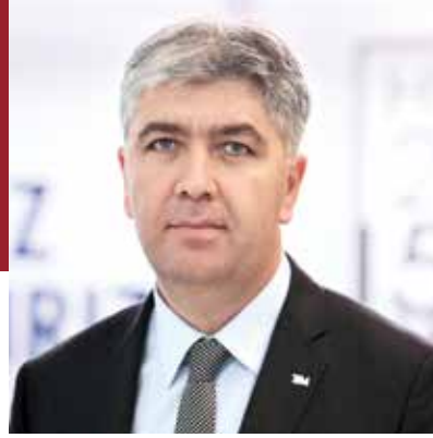
Batı Akdeniz İhracatçıları Birliği Başkanı

Türkiye ile Rusya arasında ortaya çıkan kriz durumunu nasıl fırsata çevirebiliriz üzerine düşünüyoruz. Sektör olarak buna ilişkin olarak bir dizi toplantılar gerçekleştirdik. Yeni pazarlar ve mevcut pazarlarda var olan ihracatımızı nasıl artırırız üzerine çalışıyoruz. Uzak ülkelere ihracatımızı nasıl geliştiririz, bu ülkeler ile zirai karantina anlaşmalarımız var mı yok mu? Bütün bunları masaya yatırdık. Bu doğrultuda sektör olarak çalışmalarımızı sürdürüyoruz. Avrupa ülkelerine yapılan yaş meyve ve sebze ihracatımızı nasıl artırabiliriz diye çalışmalar yapıyoruz. Ülke gruplarını belirledik. Bu çerçevede çalışanlarımızı yürütüyoruz. O ülkelerde fizibilite çalışmalarımızı yürütüyoruz. Bu doğrultuda çalışmalarımız devam edecek. Biz uzun vadede bu krizin Türkiye için bir fırsat olacağını düşünüyoruz.