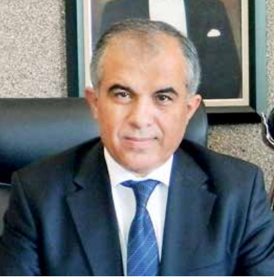
Akdeniz Yaş Meyve Sebze İhracatçıları Birliği Yönetim Kurulu Üyesi