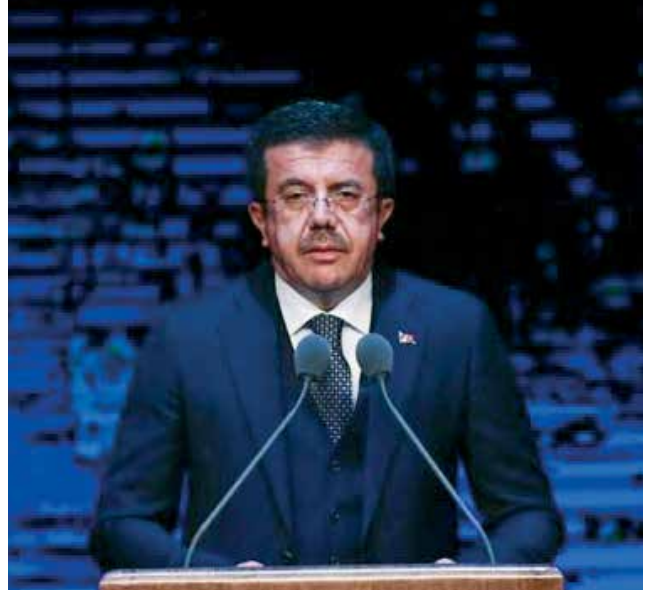
Ekonomi Bakanı Nihat Zeybekci, yıl sonunda yeni rekorlara ulaşılabileceğinin müjdesini verdi.

"Yatırıma katılan şirketlerin çoğu ya yabancı ya da yabancı ortaklı. Bu da Türkiye'ye yatırımın sürdürdüğünü gösteriyor" dedi. Türkiye'nin, bir yandan altyapı seferberliği gerçekleştirirken diğer yandan milli gelirini 850 milyar doların, ihracatını da 160 milyar doların üzerine çıkarmayı, böylelikle dünyanın 17. büyük ekonomisi olmayı başardığına dikkati çeken Zeybekci, "Enerji ve ham madde kaynaklarını başkalarının kontrol ettiği, bilgi, teknoloji, marka, patent haklarının başkasına ait olduğu, tüketim alışkanlıkları başkaları tarafından belirlenen, dağıtım kanalları başkalarının kontrolünde ve finans imkanları başkalarının ellerinde olan bir ekonomi ortamında, Türk mucizesini başarmanın sihirli formülü, milletin kesintisiz iktidarı ve Cumhurbaşkanımızın yılmak bilmeyen liderliği ve azmiydi" ifadesini kullandı. Sanayi devriminden beri, Türkiye'de yüksek ve orta-yüksek teknolojiye yatırımların yeterince