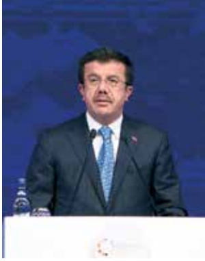
NIHAT ZEYBEKCI Ekonomi Bakanı

zirvenin ülkemizde gerçekleşmesinden de büyük memnuniyet duyduğunu iletti. Girişimcinin "ekonominin yüklemi" niteliğinde olduğunu, yüklem olmadan cümlenin kurulamayacağını vurgulayan Zeybekci, "Ben asıl girişimci olarak Cumhurbaşkanımızı görüyorum. O halde İstanbul'un halini görüp de girişimcilik ruhuyla ve anlayışıyla, o gözle bakarak İstanbul adına bir girişimcilikte bulunmuş ve İstanbul'u bu hale getirmiştir." diye konuştu.