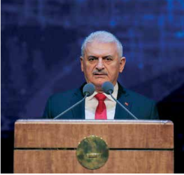
Başbakan Binali Yıldırım, Türkiye'nin ihracata dayalı bir büyüme süreci içerisinde girdiğini söyledi.