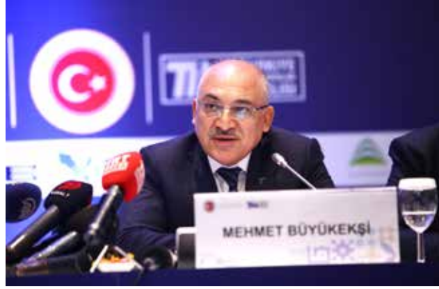
TİM Başkanı Mehmet Büyükeksi, "Bu yıl 170 milyar dolarlık ihracat rakamını aşacağız ve 2014 yılına ait 157,6 milyar dolarlık yıllık ihracat rekorunu kıracağız" dedi.

TİM Başkanı Mehmet Büyükeksi'nin açıkladığı