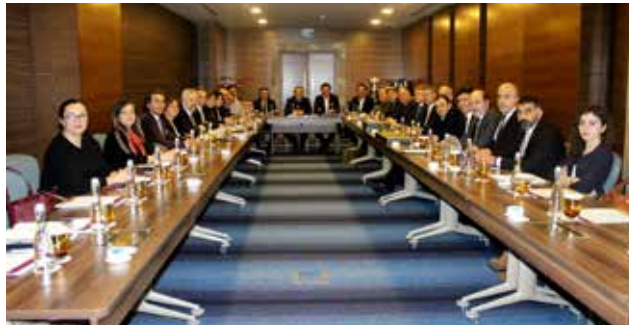
Hazır Giyim ve Konfeksiyon Sektör Kurulu, Bursa'da düzenlenen çalıştayda tekrar bir araya geldi.