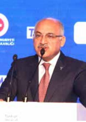
MEHMET BÜYÜKEKŞİ TİM Başkanı

TİM Başkanı Mehmet Büyükeksi, "Dünya dış ticaretinin 2018'de yüzde 4-5 büyümesi, yaklaşık 17 trilyon doların üzerine çıkması bekleniyor" dedi.