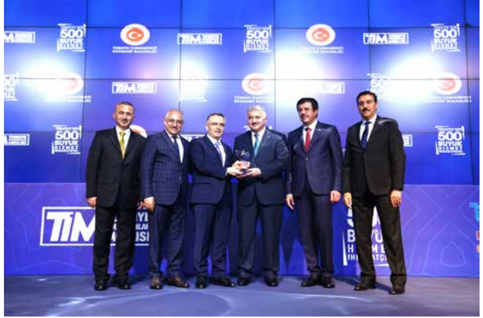
İlk 10 firma ve 17 alt sektörde en çok ihracat yapan ilk 3 firmaya ödülleri Ekonomi Bakanı Nihat Zeybekci, Maliye Bakanı Naci Ağbal ile Gümrük ve Ticaret Bakanı Bülent Tüfenkci'nin katıldığı törenle verildi.