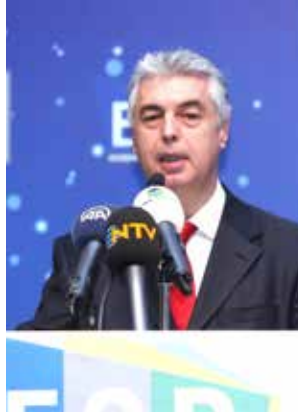
CELAL TOPRAK EGD Başkanı

TİM Başkanı Mehmet Büyükeksi, "Dünya dış ticaretinin 2018'de yüzde 4-5 büyümesi, yaklaşık 17 trilyon doların üzerine çıkması bekleniyor" dedi.