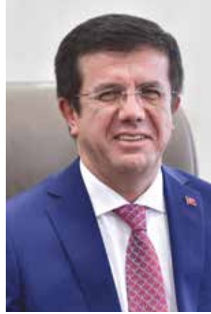
NİHAT ZEYBEKÇİ Ekonomi Bakanı

mağdur etmeyeceğine olan inancımız tamdır. Bu nedenle gıda enflasyonuna karşı uzun vadeli tek çözüm yolu olan yerli üretimin artışı için hükümetimizden üretimi ve verimliliği arttıracak destekler, üretim maliyetlerini düşürecek eylemler bekliyoruz."