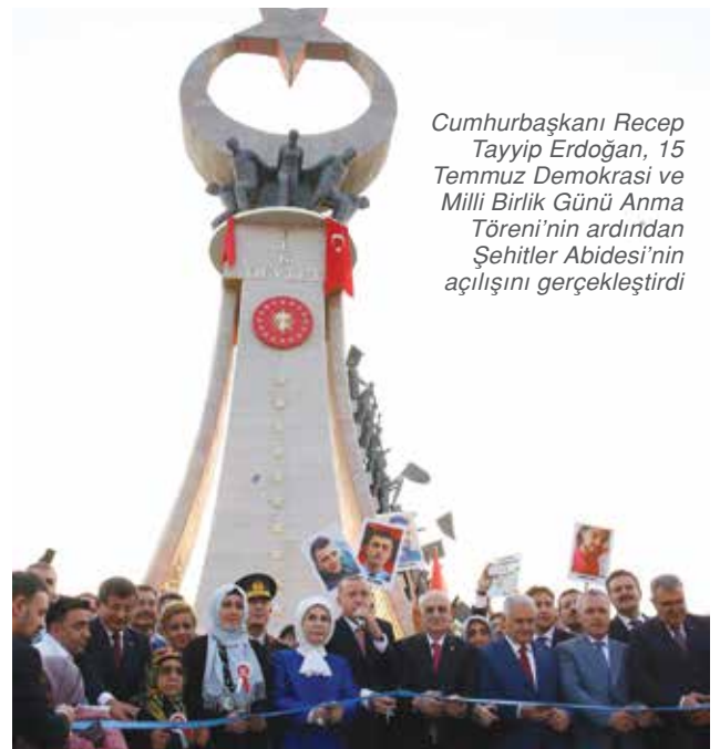
Cumhurbaşkanı Recep Tayyip Erdoğan, 15 Temmuz Demokrasi ve Milli Birlik Günü Anma Töreni’nin ardından Şehitler Abidesi’nin açılışını gerçekleştirdi

• “Biz bu mekânı yaparken, onları unutmuyacağız, unutturmayacağız diye yaptık. Rastgele bir araya gelmiş insan topluluklarıyla milletler arasında fark budur. Topluluklar anlık çıkarlar için bir arada bulunurken, milletlerse canlarını vermeyi göze alırlar. Türk milleti, kutsallarını korumak uğruna canını vermekten çekinmeyeceğini göstermiştir. Biz sıradan göçebe bir kavim değiliz. Biz milletiz, onlarsa illet.”