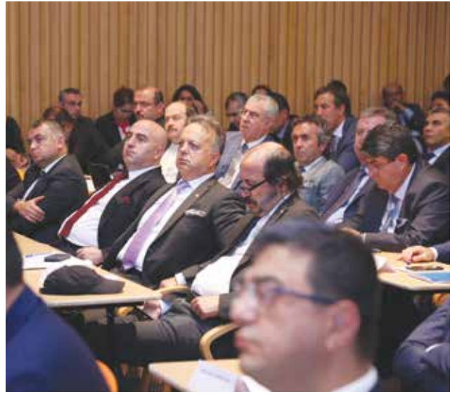
İhracatçı Birlik Başkanları da TİM tarafından düzenlenen 15 Temmuz Anma Programı'na katıldı.

Büyükekşi, şunları söyledi: "Ülkemizin birlik ve beraberliğine, yüce milletimizin ise canına kastettiler. O gece hiç bitmeyecek bir gece gibi geldi hepimize. İhanete ve en acı tablolara şahit olduk. Meydanlara akın eden milyonlarca insan canlarını ateşe attı. 16 Temmuz sabahına Türkiye tek yürek olarak uyandı. Gencinden yaşlısına herkes, devasa bir Kaf Dağı'nı omuzladı. İşte o gece Türkiye'nin sadece geleceği değil, geçmişi de aydınlandı. Dost, düşman herkes gördü ki ülkemizin yolunu hiç kimse kesemeyecek, hiç kimse ilerleyişimize mani olamayacak. TİM olarak darbe girişiminin başladığı ilk saatlerden itibaren dik duruşumuzu sergiledik.