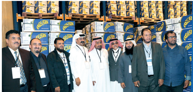
MENA’den gelen 45 kişilik heyet ihracat firmalarını ziyaret etti.

Mersin’in özellikle meyve üretiminde lider konumunda olduğuna değinen Bakan Elvan, “Tarım ve hayvancılık ile gıda ürünleri ve içecek imalatı Mersin’den yapılan ihracatın temel sektörleridir. Bitkisel ve hayvansal üretim ile gıda ürünleri imalatı, Mersin ekonomisi içinde rekabetçiliği en yüksek olan sektörlerdir. Topraklarının 4’te 1’i tarım arazisi olan Mersin, ülke geneli meyve üretiminde 1’nci, sebze üretiminde 3’üncü, örtü altı tarım alanlarının büyüklüğü ve üretiminde ise 2’nci sıradadır. Ülkemizdeki limon ve muz üretiminin yaklaşık 4’te 3’ünü çilek üretiminin ise yüzde 40’ını karşılayan Mersin bu ürünlerde Türkiye’de lider konumunda olup kayısı ve biber üretiminde ise ülkemizde 2’nci sıradadır” açıklamasında bulundu.