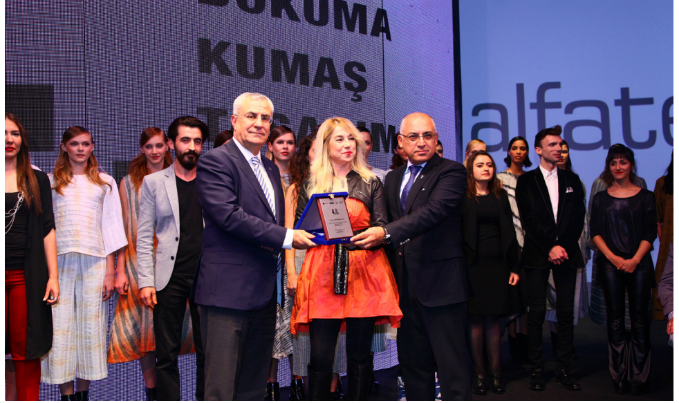
Genç tasarımcıları iş dünyasına kazandıran ATHİB Dokuma Kumaş Yarışması, aynı zamanda ihracatçıları bir araya getiren Çukurova’nın en önemli etkinliklerinden biri.