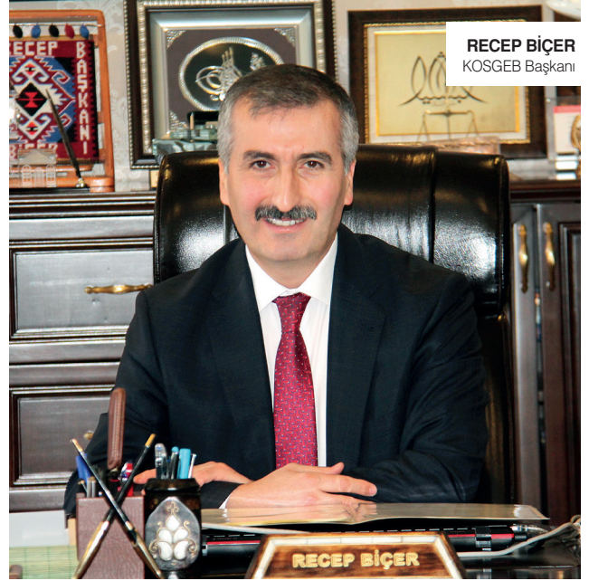
RECEP BIÇER KOSGEB Başkanı

244.980 başvuru, 15.000 işletmeye kredi verildi