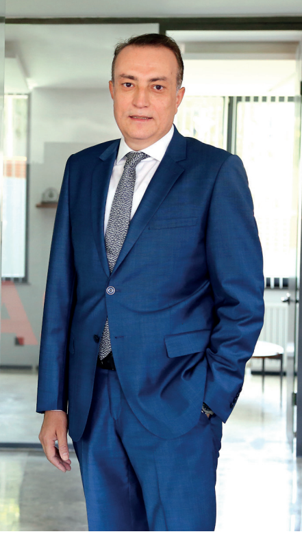
Akdeniz Demir ve Demir Dışı Metaller İhracatçıları Birliği Başkanı