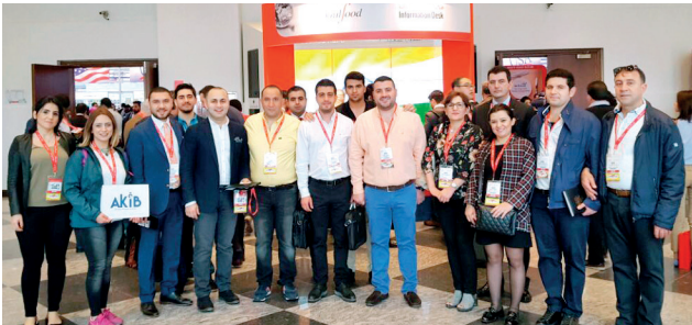
AKİB, Gulfood Fuarı'na 24 kişilik heyet ile katılım gösterdi.