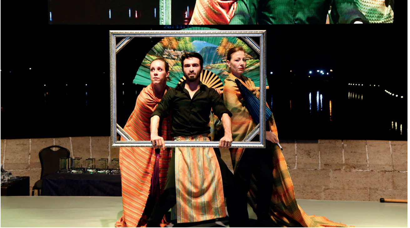
2012 yılından bu yana düzenlenen "ATHİB Dokuma Kumaş Tasarım Yarışması" tekstil sektörünün genç taze kanlarının sektörde 'tasarımcı' olarak yer edinebilmeleri ve kendilerini ispat edebilmeleri adına büyük bir adım olarak görülüyor.

elyaf ihracatında hem değer hem miktar bazında oldukça önemli bir artış görülürken aynı olumlu artışın suni-sentetik ipliklerde de kaydedildiği görüldü. Fakat önemle üzerinde durulan sentetik suni liflerden iplik ve pamuk ipliğindeki ithalat oranları oldu. Hızlı bir şekilde artış gösteren ithalat ile son 3 yılda yüzlerce fabrikanın kapanması da sektörün ciddi sorunları arasında yer alıyor. Sektörün yaşadığı bu sıkıntıya dair açıklamada bulunan Kıvanç, Türkiye'nin kendi üreticisini koruma adına gerekli tedbirleri alamadığını ifade ederek bu sebepten birçok işletmenin kapanmak zorunda kaldığını söyledi. Başkan Zeki Kıvanç, Türkiye'nin kendi üreticisini koruyacak tedbirleri alamadığını belirterek, bu yüzden birçok işletmenin ya kapanmak zorunda kaldığını ya da düşük kapasitelerle çalışmak zorunda kaldığını dile getirdi. Zeki Kıvanç, Türkiye'nin