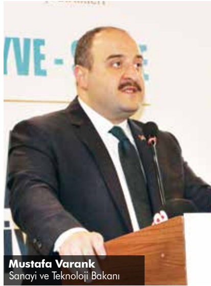
Mustafa Varank Sanayi ve Teknoloji Bakanı

Sanayi ve Teknoloji Bakanı Mustafa Varank ise Mersin'in yüksek dinamizm ve iş yapma isteğiyle Anadolu'nun pek çok kentine örnek olduğunu söyledi.