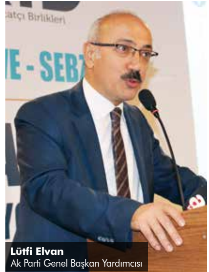
Lütfi Elvan Ak Parti Genel Başkan Yardımcısı

AK Parti Genel Başkan Yardımcısı Lütfi Elvan ise yaş meyve sebzenin binlerce kişiyi ilgilendiren büyük bir sektör olduğunu hatırlattı. Sektörün her aşamasının büyük bir hassasiyet ve zamanla yarışmayı gerektirdiğini bildiren Elvan, şunları söyledi: "Bir makine imal edersiniz