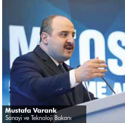
Mustafa Varank Sanayi ve Teknoloji Bakanı

MTOSB 3. Bölge'nin kente ciddi bir dinamizm kazandırması için yatırımcı ve iş insanlarının yanında olduklarını ifade eden Varank, “11 ayda 1,6 milyar dolarlık bir ihracata imza attınız. Bu tutar geçen seneye göre yüzde 18'lik bir artışa tekabül ediyor. Bu oranla Türkiye ortalamasının üzerinde bir başarı gösterdiniz, devamını da getireceğinize inanıyorum. İlimizde farklı sektörlerde düzenlenen 742 teşvik belgesiyle 95 milyar liralık sabit sermaye yatırımını destekledik ve 21 bin kişilik ilave istihdam oluşmasına katkı sağladık. Teşvik mevzuatımıza göre 3'üncü Bölgede yer alan Mersin, sabit yatırım tutarı bazında ilk sırada yer aldı.” dedi.