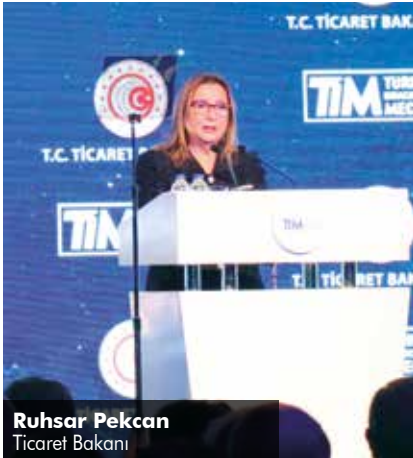
Ruhsar Pekcan Ticaret Bakanı

Ticaret Bakanı Ruhsar Pekcan, Türkiye'nin 2017 yılında 43,7 milyar dolar ile dünyada en fazla hizmet ihracatı yapan 29. ülke konumunda olduğunu söyledi. Türkiye'nin hizmet ihracatında kısa sürede önce ilk 20'ye, sonra da ilk 10'a rahatlıkla girebilecek potansiyelle sahip olduğunu dile getiren Pekcan, şöyle devam etti: "2018 yılının Ocak-Ekim döneminde bir önceki yılın aynı dönemine kıyasla yaklaşık yüzde 22 oranında artışla 22 milyar dolar seviyesinde hizmet ticareti fazlası elde etmiş bulunmaktayız. 1980'ler Türkiye'nin mal ihracatında tekstil-konfeksiyonla,