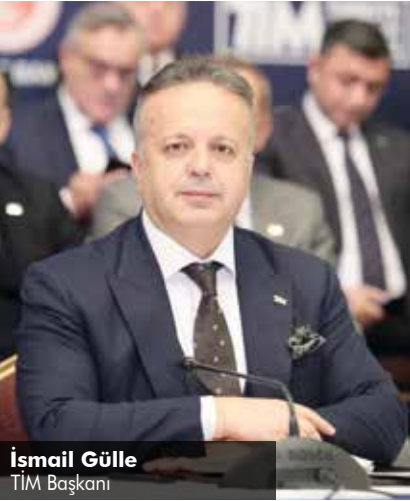
İsmail Gülle TİM Başkanı

İhracat rakamlarını değerlendiren ve 2019 yılı hedefleri hakkında bilgiler veren TİM Başkanı İsmail Gülle ise 2017 yılı sonunda "2018 ihracatta rekorlar yılı olacak" dediklerini hatırlatarak, "Çok şükür, ihracatçılarımızla birlikte sözümüzü tuttuk. 2018'i rekorlarla kapattık. İnşallah, 'Yeni Ekonomi Programı'nda 2019 yılı için öngörülen 182 milyar dolarlık ihracat hedefini de yakalayacağız; hatta aşacağız. Geçtiğimiz yıl mal ihracatında yakaladığımız ivmeyi koruyarak hizmet ihracatı, transit ticaret, ihracatta dijitalleşme ve e-ihracat gibi kritik başlıklar üzerine eğilecek; ihracatta yenilikler gerçekleştireceğiz. TİM olarak ihracatta 2019 yılı hedefimizi 'İhracatta Sürdürülebilirlik ve Yenilik Yılı' olarak belirledik." şeklinde konuştu.