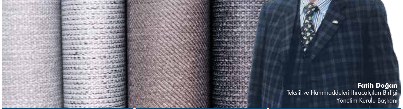
Fatih Doğan Tekstil ve Hammaddeleri İhracatçıları Birliği Yönetim Kurulu Başkanı

2018 yılını yüzde 6 oranında artışla 931 milyon dolar ihracat ile kapatan Akdeniz Tekstil ve Hammaddeleri İhracatçıları Birliği (ATHİB), ülke geneli tekstil ve hammaddeleri ihracatında yüzde 11 pay sahibi.