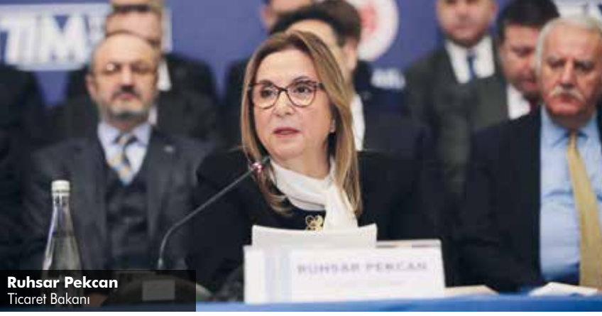
Ruhsar Pekcan Ticaret Bakanı

ğini söyleyen Bakan Pekcan, böylece ihracatın ithalatı karşılama oranının 8,2 puan artışla yüzde 75,3'e yükseldiğini bildirdi. 2019 yılında ihracatın ithalatı karşılama oranında bu yükselmenin süreceğini ifade eden Pekcan, "Hedefimiz, ülkemizin dünya ile ticari ilişkilerini uzun vadede dengeli bir yapıya kavuşturmak. Böylece ülkemizin dış finansman ihtiyacını kademe kademe azaltmaktır." diye konuştu.