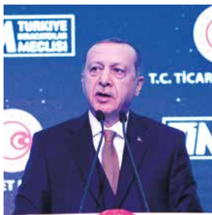
Recep Tayyip Erdoğan Cumhurbaşkanı

Törende, Türkiye’nin 500 Büyük Hizmet İhracatçısı Araştırması’na göre Türkiye genelinde en çok ihracat yapan ilk 10 firma ile 17 sektördeki ilk 3 firmaya ödülleri verildi. 2017 rakamlarına göre yapılan sıralamada Türk Hava Yolları (THY) ülke genelinde birinci olurken, onu SunExpress ve Pegasus takip etti. İstanbul Yeni Havalimanı’nın inşa etmek üzere oluşturulan konsorsiyumda yer alan firmalardan dördüne de özel ödül verildi.