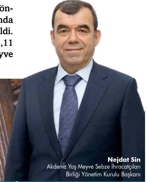
Nejat Sin Akdeniz Yaş Meyve Sebze İhracatçıları Birliği Yönetim Kurulu Başkanı

Türkiye'nin, 2018 Yaş Meyve Sebze ihracatı 2 milyar 325 milyon dolar