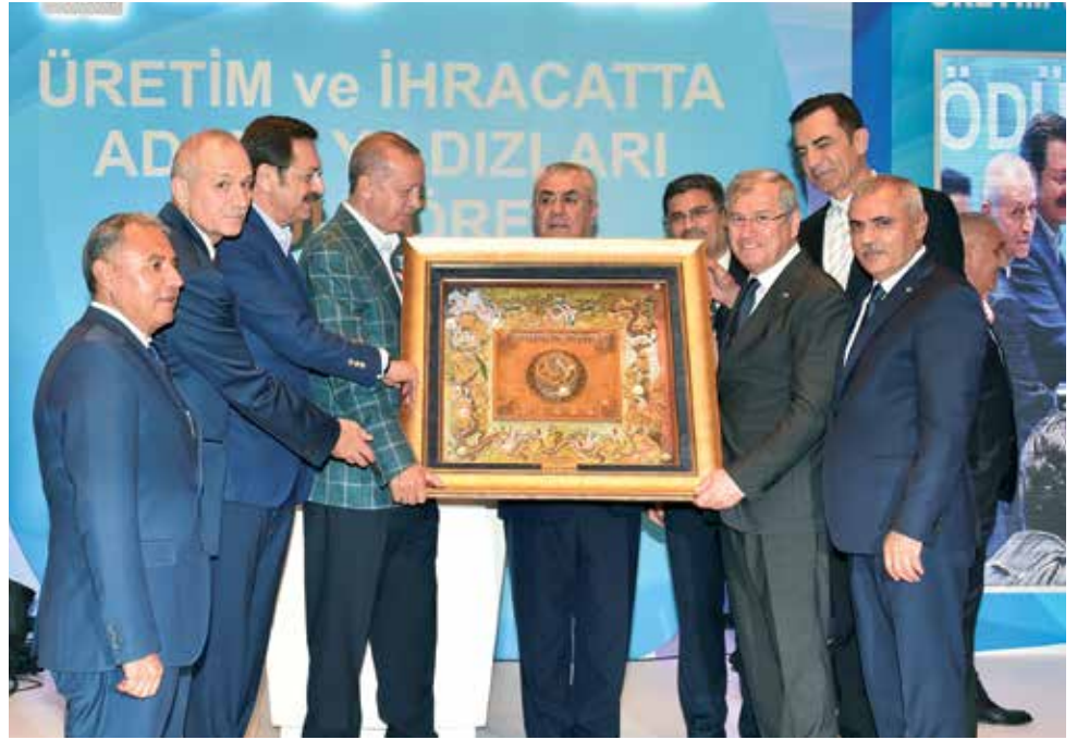
Cumhurbaşkanı Recep Tayyip Erdoğan: "Yeni dönemde Adana'yı her alanda şaha kaldırmakta kararlıyız" dedi.

Türkiye'yi bugün getirdikleri noktayı önemli gördüklerini ama yeterli görmediklerini vurgulayan Erdoğan, şöyle devam etti: "Bugüne kadar uyguladığımız ekonomi politikalarıyla Türkiye'yi ekonomik olarak içine sıkıştırıldığı cendereden kurtardık, geliştirdik, kalkındırdık, bugüne getirdik. Yeni dönemde vizyonumuzu genişletmek, stratejilerimizi