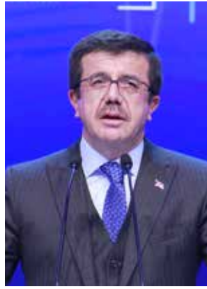
NİHAT ZEYBEKÇİ Ekonomi Bakanı

Zeybekci, Erdoğan'ın el açan Türkiye'yi 2003'ten itibaren dünyanın en hızlı büyüyen ülkeler sınıfına yükselttiğini, 2013'te aldığı borçları bitirdiğini, dünyanın en büyük projeleri hayata geçirdiğini anlattı. Yüzde 7 bin faiz oranlarını gören, topladığı verginin