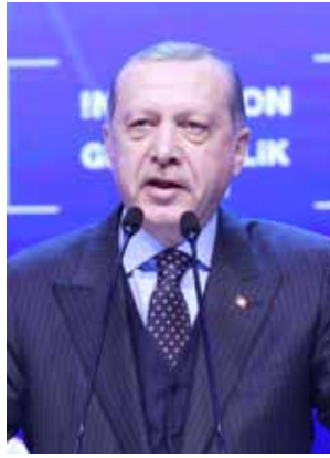
RECEP TAYYİP ERDOĞAN Cumhurbaşkanı

rın tutarı 80 milyar TL'nin üzerindedir. Proje Bazlı Teşvik Sistemi ile... Yüksek teknolojilerde ihracata yine çok iddialı destekler veriyoruz. Üretim ve ihracat yapısını değiştirecek tüm bu destekler; ekonomimiz içinde Ar-Ge'nin aldığı payın artırılmasıyla güçlendirilmelidir" dedi. Ekonomi Bakanı Nihat Zeybekci, etkinlik öncesi stantları gezdiklerini, bir stanttaki görevli ile inovasyonun sadece teknik, fizik, elle tutulur, gözle görülür bir şey olup olmadığına dair tartışma başlattıklarını kaydederek, "Kısa bir süre sonra inovasyonun teknik, fizik, mühendislik, teknoloji değil bir mantık, evrim, gelişim anlayışı ve mantalitesi olduğunu konuştuk" ifadelerini kullandı. Bu mantalitenin ülkelerin kalkınmasındaki öneminden bahseden Zeybekci, "Türkiye'nin en büyük inovatörü, çaresizlikler içindeki Türkiye'nin geleceğe daha aydınlık bakabilmesiyle ilgili en önemli inovatörü 2002 yılında bu milletin huzuruna çıkmış olan Recep Tayyip Erdoğan'dır" diye konuştu.