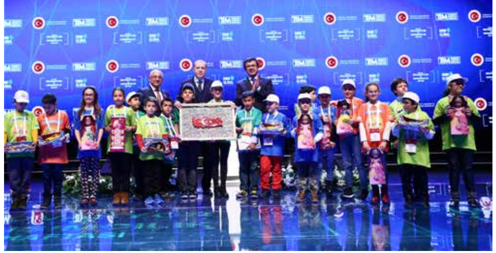
Cumhurbaşkanı Recep Tayyip Erdoğan'a maker eğitimine katılan 551 çocuğun fotoğrafının yer aldığı ve 3D yazıcıyla yaptıkları Türkiye bayraklı harita hediye edildi.

Bu dönüşümün büyük fırsatlarla ve tehditlerle dolu olduğunu dile getiren Zeybekci, bir teknolojik devrimin yaklaştığını, 10 veya 5 yıl