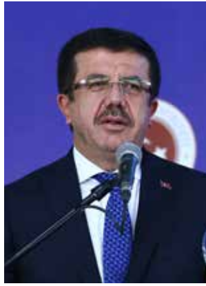
NIHAT ZEYBEKCI Ekonomi Bakanı

"OECD'nin 35 büyük ekonomisi içinde bir numara olacak. Eğer dünya kazan biz kepçe dolaşmasaydık, tüm çalışanlarımız Türkiye'nin enerjisine inanmasaydı, bir yerlerde arkamıza baksaydık, bunu başaramazdık."