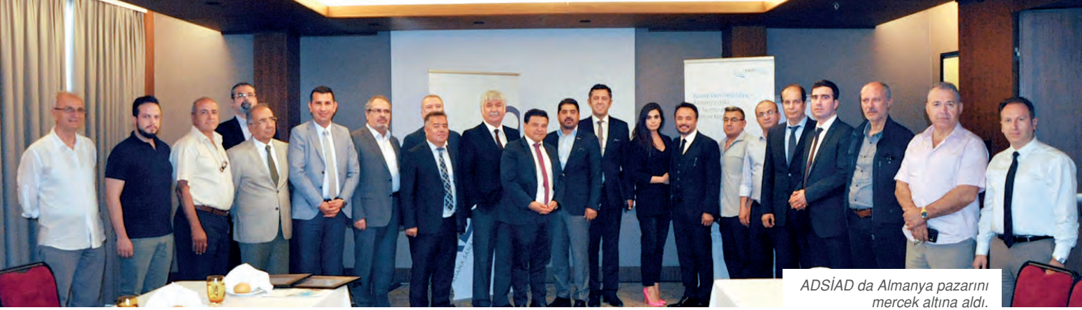
ADSİAD da Almanya pazarını mercek altına aldı.