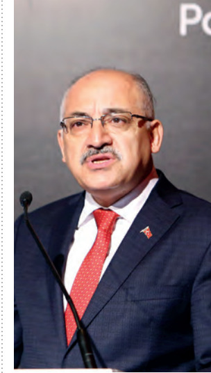
TİM Başkanı Büyükeşçi, “İhracat çalışmalarında daha da artış bekliyoruz. 2017 yılı tüm zorluklara rağmen bir atılım yılı oldu” dedi.

Forum İstanbul 2017’nin konuşmacılarından biri de Başbakan Yardımcısı Mehmet Şimşek oldu. Şimşek, teknolojinin üst seviyelerde olması için yatırım bankası kurmak istediklerini söyledi. Şimşek, “Türkiye’deki imalatın ve ihracatın maalesef üçte ikisi düşük ve orta düşük teknoloji. Bunun tersine dönmesi lazım. Üçte ikisi yüksek ve orta ileri teknoloji olmalı. Bu Türkiye’nin karşı karşıya olduğu en önemli dönüşüm. Yüksek teknolojilerin toplam ihracat içerisindeki payı sıralamasında arzuladığımız yerde değiliz. Dördüncü sanayi devrimiyle