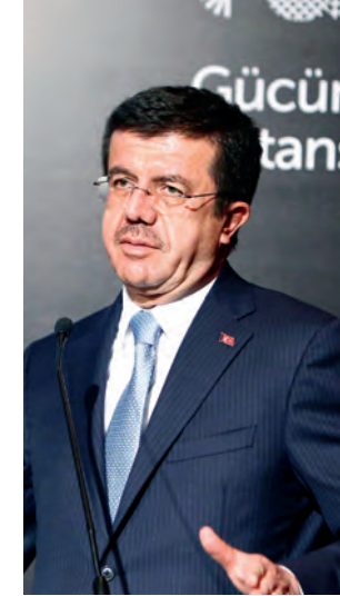
Ekonomi Bakanı Nihat Zeybekci, “Uzun vadede Türkiye’yi güzel günler bekliyor. Bir yıl içerisinde 6,5 milyon vatandaşa istihdam yarattık” dedi.