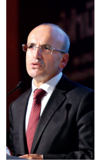
Başbakan Yardımcısı Mehmet Şimşek, “Türkiye’deki imalatın ve ihracatın üçte ikisi düşük ve orta düşük teknoloji. Bunun tersine dönmesi lazım” dedi.

birlikte kavramlar değişiyor. Eskiden otomotiv ileri teknoloji sayılıyordu, şimdi yapay zekâdan bahsediyoruz. Geçen yıl yeni bir patent yasası çıkardık. Ar-Ge paketi Meclis’te kabul edildi. Yeni dönemde ne yapacağız? Kitle fonlaması ve gelecek vadede yüksek teknolojik şirketlere risk olarak doğrudan destek verecek yeni bir yatırım bankası kurabiliriz” şeklinde konuştu.