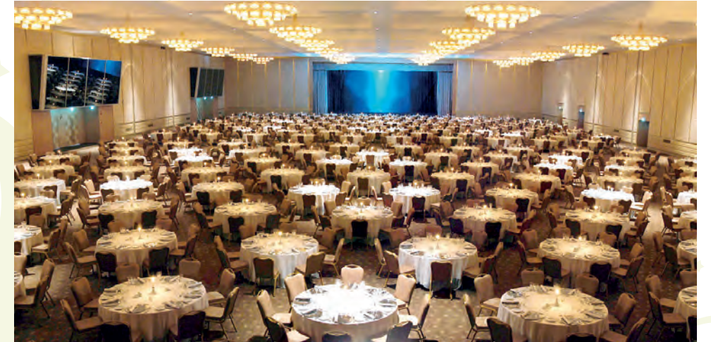
WOW İstanbul, 4 bin kişi kapasitesine sahip Safir ile İstanbul'un en büyük kolonsuz toplantı salonunda Ramazan'ı karşılıyor.

Bu eşsiz buluşmayı gerçekleştiren otellerin başında günde yaklaşık 150 ülkeye uçuşun gerçekleştiği İstanbul Atatürk Havalimanı'nın ve İstanbul Dünya Ticaret Merkezi, İstanbul Fuar Merkezi, CNR Expo Center gibi ticaret ve fuar merkezlerinin hemen yanında bulunan WOW İstanbul Hotels & Convention Center geliyor. Her yıl ulusal ve uluslararası birçok kongre, konferans, düğün ve davete başarılı bir şekilde ev sahipliği yapan WOW İstanbul'da yok yok. WOW Convention Center, 6 bin 500 kişi kapasitesi ve 34 toplantı salonu ile İstanbul'un konaklamalı en büyük kongre merkezi unvanına sahip. Üstelik bu fiziksel büyüklüğünün yanında, her yıl ev sahipliği yaptığı ve ziyaretçilerinin hatıralarında izler bıraktığı onlarca büyük kongre ve toplantı ile de alanının en tecrübeli ve donanımlı