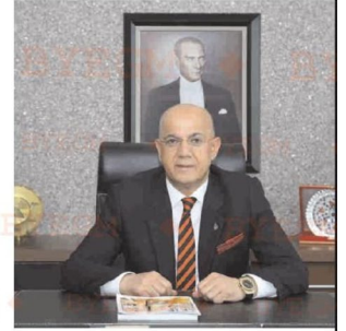
%12, Ezcaleri Ürünleri'nde %17 artış yaşadık" diye konuştu. Plastik ve Mamulleri ihracat artışında da, Almanya, Irak ve Cezayir pazarları etkili iken, Anorganik Kimyasallar alt sektöründe ise İtalya ve Hindistan'daki artışlar dikkat çekti. 2017 yılı AKMİB ihracatında ilk sıralarda yer alan BAE'de %150, Birleşik Devletler'de %147, Singapur'da %35, Malta'da ise %81 oranında artış yakaladık.

-AKMİB olarak Türkiye kimya sektörü ihracat artışında %25 artış yakaladık 2017 yılında ise Akdeniz Kimyevi Maddeler ve Mamulleri İhracatçıları Birliği (AKMİB) olarak, %15 oranında gerçekleşen Türkiye kimya sektörü ihracat artışında %25 artış yakaladığımızın altını çizen Ateş, "AKMİB ihracatında %75 oranı ile her zaman en büyük paya sahip Mineral Yağlar, Mineral Yağlar ve Ürünler'inde 2017 yılında bir önceki yıla kıyasla %32 ihracat artışı var. Bu artışta BAE ve Birleşik Devletler'e yapılan ihracat artışlarının etkisini görüyoruz. Bu ürün grubu dahil ilk sıralarda yer alan 4 alt sektörün grubumuzda da yine artış var. Orneğin, Plastikler ve Mamulleri'nde %19, Anorganik Kimyasallar'da %28, Boya Vernik Mürekkep ve Müstahzarlarda %12, Ezcaleri Ürünleri'nde %17 artış yaşadık" diye konuştu.